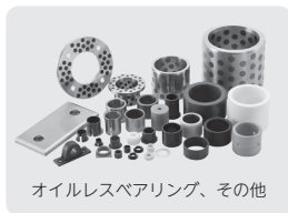
オイルレスベアリング、その他