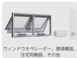
ウィンドウオペレーター、環境機器、住宅用機器、その他